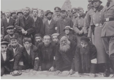
Grupa olkuskich Żydów zmuszona do pozowania z Niemcami na olkuskim rynku.