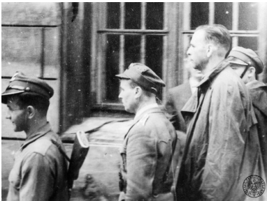
Amon Göth prowadzony pod eskortą w trakcie swojego procesu przed Najwyższym Trybunałem Narodowym w Krakowie, 1946 r.

„za najwłaściwszą uważał karę śmierci przez zastrzelenie więźnia na miejscu [...] Strzelał on przy każdej sposobności. [...] Przy budowie drogi zastrzelił kobietę, która jego zdaniem nie naładowała dość dużo kamieni na taczki. Wypadków takich zna każdy więzień płaszowski dziesiątki, jeśli nie setki”.