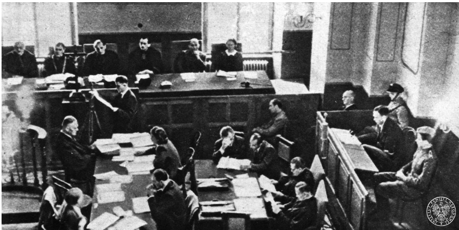
Sala rozpraw w gmachu Sądu Okręgowego w Krakowie w czasie procesu Amona Götha przed Najwyższym Trybunałem Narodowym, 1946 r.

https://przystanekhistoria.pl/pa2/tematy/zbrodnie-niemieckie/85949,Morderca-z-Plaszowa.html