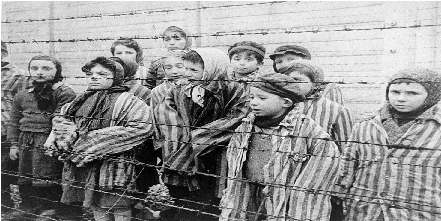
Dzieci za drutami obozu. Kadr z filmu sowieckiego dokumentującego wyzwolenie Auschwitz

https://przystanekhistoria.pl/pa2/tematy/zbrodnie-niemieckie/86204,Teza-o-banalnosci-zla-Hannah-Arendt-jej-sprawozdanie-z-procesu-Eichmanna-i-obser.html