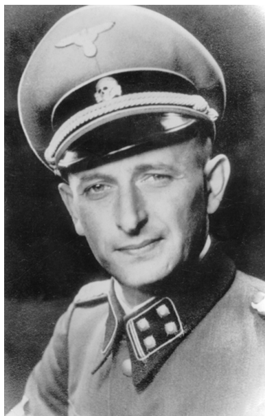
Adolf Eichmann w 1942 roku

„To prawda, że uważam obecnie, iż zło nigdy nie jest «radykalne», a tylko skrajne i nie posiada ono żadnej głębi ani jakiegokolwiek demonicznego wymiaru”.