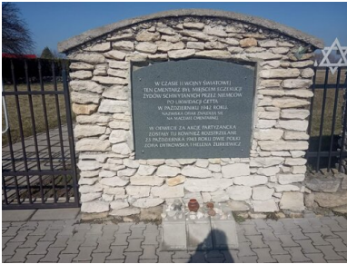
Cmentarz żydowski w Busku-Zdroju

W niedługim czasie po tym wydarzeniu John i Schwenke dokonali kolejnej zbrodni. Na cmentarz żydowski przyprawdzili starszego Żyda oraz dwie młode Żydówki. Mężczyzna na rozkaz Niemców wszedł do wykopanego dołu, kobiety zaś błagały o darowanie im życia. Jedna z nich będąca zapewne w szoku wyjęła przybory kosmetyczne, po czym zaczęła się malować. John pchnął obydwie z taką siłą, że spadły do dołu. Wówczas Schwenke zastrzelił obydwie, oddając do nich kilka strzałów.