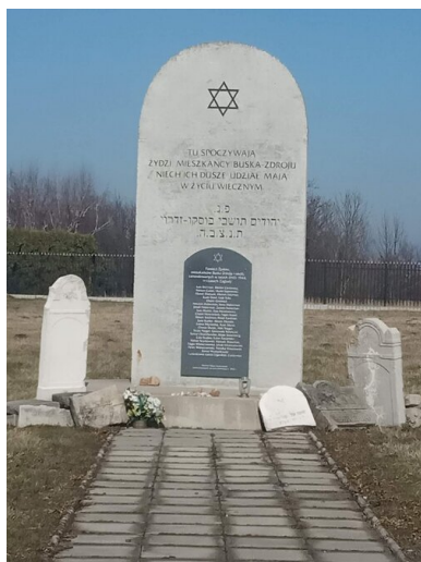
Cmentarz żydowski w Busku-

Wróbla wkrótce zwolniono. Dziurdę rozstrzelano na cmentarzu żydowskim.