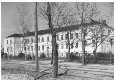
Budynek zajmowany w czasie okupacji przez niemiecką administrację Kreishauptmannschaft Busko, 1942 r.