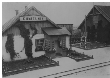
Budynek stacji kolejowej w Chmielniku k. Kielc. Okres Drugiej

Aresztowanych przetrzymywano początkowo w Jędrzejowie, a następnie w więzieniu w Kielcach przy ul. Zamkowej.