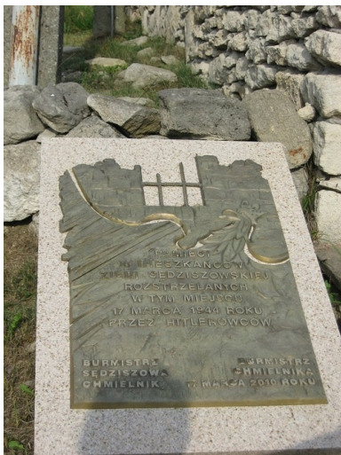
Tablica upamiętniająca kolejarzy z Sędziszowa