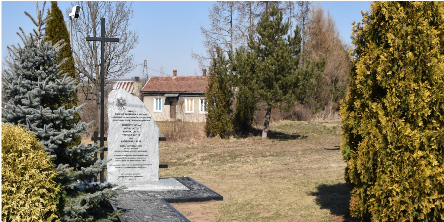
Fot.: Maciej Korkuć (IPN)

https://przystanekhistoria.pl/pa2/tematy/zbrodnie-niemieckie/90565,Ratujac-bliznich-zlozyli-najwyzsza-ofiare.html