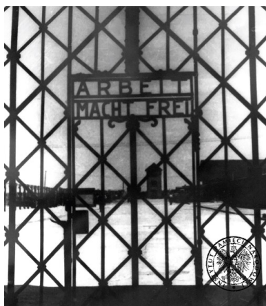
Brama obozu koncentracyjnego Dachau, zdjęcie z okresu funkcjonowania lagru.

Na terenie Rzeszy (w granicach z 31 grudnia 1937 r.) oraz w siedemnastu okupowanych państwach Europy Niemcy zorganizowali łącznie ok. 12 tys. obozów, podobozów, komand pracy, gett i więzień. Blisko połowę takich ośrodków zlokalizowano na ziemiach polskich – więziono w nich ok. 7,5 mln, z czego zamordowano 6,7 mln, głównie Żydów i Polaków. Z niemal 4,5 mln obywateli RP, którzy przeszli przez hitlerowskie lagry, zginęło ok. 3,5 mln 9 . W samych obozach koncentracyjnych i ośrodkach natychmiastowej zagłady zginęło co najmniej 7,2 mln spośród ok. 9 mln więźniów (81 proc.). Dokładnej liczby więźniów i ofiar nie sposób ustalić, gdyż oprawcom udało się w znacznym stopniu zatrzeć ślady swoich zbrodni.