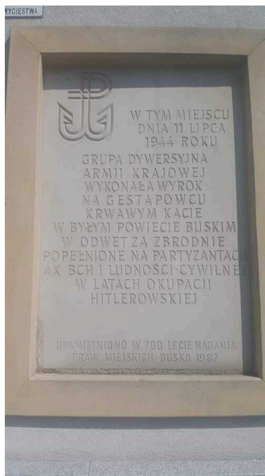
Miejsce wykonania zamachu.

27 lipca 2014 r. Buskie Stowarzyszenie „Pro Memoria” wraz z Buskim Samorządowym Centrum Kultury zorganizowało inscenizację historyczną zamachu na Petera.