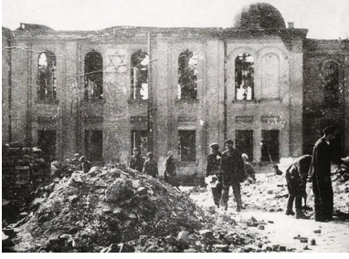
Wielka Synagoga w Białymstoku po zniszczeniu, 1941 r.