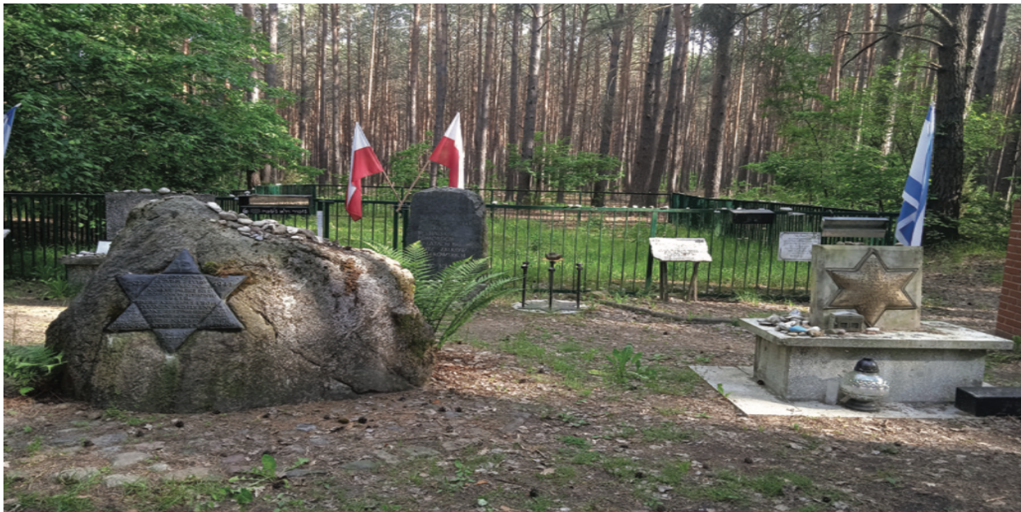
Las koło wsi Łopuchowo kryje szczątki ponad 2 tys. żydowskich mieszkańców Tykocina zamordowanych 25 i 26 sierpnia 1941 r.

https://przystanekhistoria.pl/pa2/tematy/zbrodnie-niemieckie/93347,Niemieckie-zbrodnie-na-Zydach-na-ziemi-lomzynskiej-latem-1941-roku.html