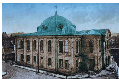
Wielka Synagoga w Białymstoku

Latem 1941 r. Niemcy rozpoczęli na tym terenie akcję masowych mordów ludności żydowskiej. Po zdobyciu nowych obszarów jednym z celów niemieckich okupantów było zabezpieczenie zaplecza frontu. Chodziło o wyeliminowanie wszystkich współpracowników sowieckiego reżimu.