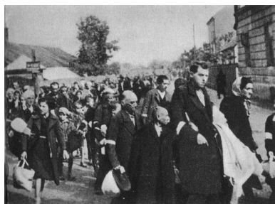
Deportacja Żydów rzeszowskich do obozu w Bełżcu, 1942 r. (domena publiczna)

wyłapywali ukrywające się osoby, a następnie eskortowali je na miejsce zbiórki. Zdarzało się, że część osób rozstrzelano na miejscu. Na placu zbiorczym dokonywano rewizji, a także selekcji. Niewielką grupę, ok. 200 osób, pozostawiono do porządkowania terenu getta.