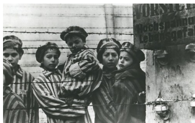
Dzieci - więźniowie obozu oświęcimskiego po wyzwoleniu, luty 1945 r.

Kolejny problem stanowili umysłowo chorzy, a wśród nich niebezpieczni dla otoczenia furiaci, których należało pilnować, aby nie doszło np. do zaproszenia przez nich ognia i pożaru.