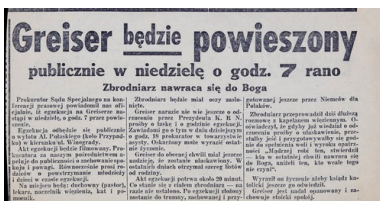
Wycinek prasowy dotyczący egzekucji Arthura Greisera, 1946 r.

Pomimo posiadania siedziby w Poznaniu Arthur Greiser postanowił wybudować willę poza miastem. Wybór padł na Jezioro nad Jeziorem Góreckim – obecnie znajduje się tam siedziba Dyrekcji i Muzeum Wielkopolskiego Parku Narodowego, a miejscowość jest częścią Mosiny. Na wybór lokalizacji wpływ miała odległość od Poznania (około 20 km) oraz zalesienie terenu umożliwiające przeprowadzanie polowań.