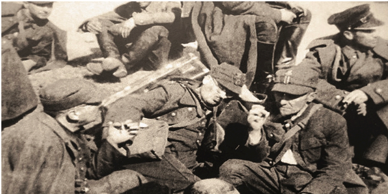
Polscy jeńcy, wrzesień 1939 r. Kadr z sowieckiej kroniki filmowej

https://przystanekhistoria.pl/pa2/tematy/zbrodnie-sowieckie/106707,Sowieckie-obozy-specjalne-dla-obywateli-polskich-w-latach-1939-1940.html