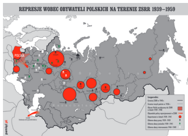
Mapa represji wobec obywateli polskich na terenie ZSRR w latach 1939-1959