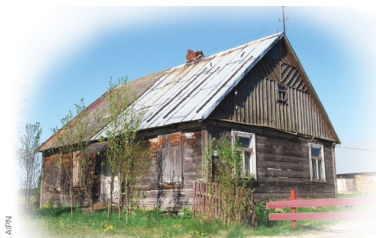
Dom państwa Szcyców przy ul. Rybnej 24 w Sztynie (stan obecny), w którym Sowieci prowadzili brutalne przesłuchania osób zatrzymanych w obławie; nie wiadomo, ile ich było; po przesłuchaniach część wywieziono prawdopodobnie do Augustowa, gdzie dokonano dalszej selekcji

W tej sytuacji już wiosną 1945 roku, po przesunięciu się frontu na zachód, polskie podziemie zaczęło odbudowywać oddziały. Partyzanci na nowo podjęli działalność: atakowali konwoje stad bydła pędzonych z Prus Wschodnich do ZSRS, rozbijali posterunki MO, napadali na urzędy gmin i instytucje ustanawiane przez nowe władze. Jak wynika ze sprawozdania Wojewódzkiej Rady Narodowej w Białymstoku, tylko od początku marca do 1 lipca 1945 roku w całym województwie białostockim podziemie niepodległościowe przeprowadziło łącznie 186 akcji. W samym powiecie suwalskim do końca maja 1945 roku polscy partyzanci rozbili siedemnaście z osiemnastu posterunków MO, wykonali 23 wyroki śmierci na donosicielach i najgorliwszych współpracownikach sowieckiego okupanta, atakowali żołnierze Armii Czerwonej i NKWD.