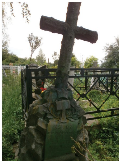
Grób ks. Erazma Wierzejskiego w Mohylewie Podolskim.

JW: To też mogło odegrać swoją rolę. Uderza jednak fakt, że Niemcy podali liczbę kilkudziesięciu odnalezionych Polaków, a to wydaje mi się celowym działaniem – jakby chodziło im o zmniejszenie skali mordy osób polskiej narodowości.