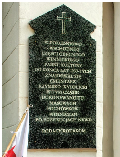
Tablica na budynku dawnej katolickiej kaplicy w Winnicy odsłonięta 31 sierpnia 2014 r.

Na początku maja tego roku dotarł do nas sygnał o planach wsparcia naszych inicjatyw ze strony Fundacji „Pomoc Polakom na Wschodzie”. Może już wkrótce zdołamy opracować kolejną część skanów z kijowskiego Archiwum Służby Bezpieczeństwa Ukrainy, gdzie są przechowywane materiały NKWD. Chodzi o dokumenty, które potwierdzą, że ofiary były mordowane właśnie w Winnicy, Berdyczowie, Płoskirowie, Mohylewie Podolskim... Musimy mieć dowody, żeby udaremnić starania obrońców komunizmu, którzy podważają nasze ustalenia.