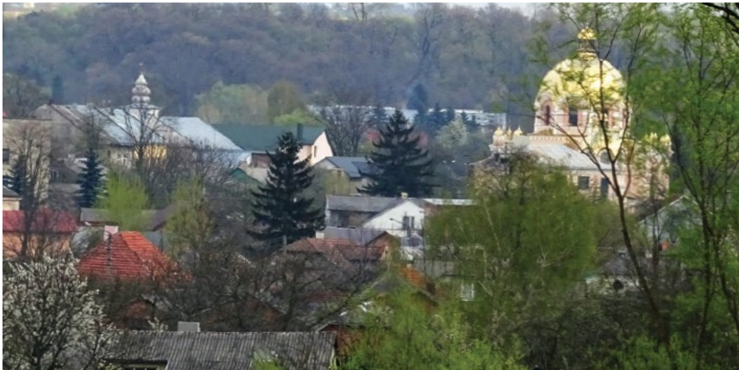
Szukam prawdy o „podolskim Katyniu”

https://przystanekhistoria.pl/pa2/tematy/zbrodnie-sowieckie/64953,Szukam-prawdy-o-podolskim-Katyniu.html