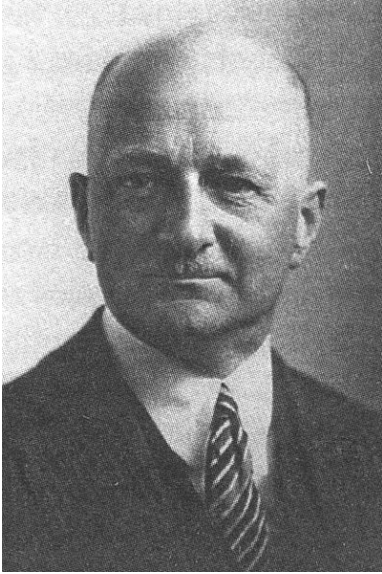
François Naville.