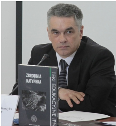
Janusz Kurtyka w czasie promocji wydanej przez IPN teki edukacyjnej Zbrodni Katyńska oraz książki Zbrodnia Katyńska. W kręgu prawdy i kłamstwa, Warszawa, 6 kwietnia 2010 r.

Ustawowym celem i kierunkiem śledztwa polskiego jest ustalenie charakteru Zbrodni Katyńskiej i jej zakwalifikowanie w kategoriach obowiązującego w Polsce systemu prawnego. Nie ma wątpliwości, że Zbrodnia Katyńska stanowi zbrodnię ludobójstwa, której istota polega na podejmowaniu działań zmierzających do wyniszczenia grup ludności z powodu odrębności narodowej, etnicznej, politycznej, wyznaniowej lub światopoglądowej. Podstawą penalizacji takich działań są Konwencja ONZ z 9 grudnia 1948 roku w sprawie zapobiegania i karania zbrodni ludobójstwa oraz przepisy polskiego Kodeksu karnego.