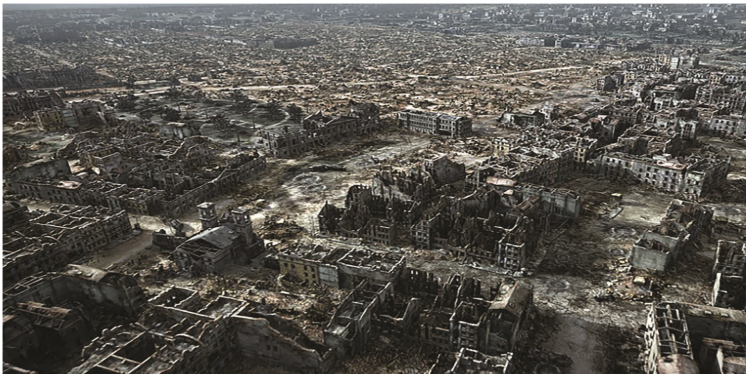
Warszawa w 1945 r. (rekonstrukcja). Kadr z filmu Miasto ruin produkcji Muzeum Powstania Warszawskiego

https://przystanekhistoria.pl/pa2/tematy/zbrodnie-sowieckie/67125,Niezakończone-rozrachunki.html