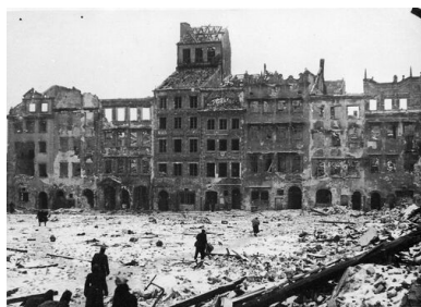
Warszawskie Stare Miasto w 1945 r.

W skrajnie trudnych warunkach wojennych swoistym fenomenem było istnienie Polskiego Państwa Podziemnego dysponującego własną konspiracyjną armią i strukturami administracyjnymi, niezwykle istotnymi zwłaszcza w zakresie oświaty (tajne nauczanie) i wymiaru sprawiedliwości. Poczynania na tych polach nie były iluzoryczne – wymierzano i wykonywano wyroki, przede wszystkim w przypadku zdrajców, kształcono dzieci i młodzież. Przygotowywano się również do odbudowy kraju, już po wojnie, w kształcie skorygowanym ustrojowo, ale bez ubytków terytorialnych. Stąd zjawisko kolaboracji z okupantami było marginalne, a żadna z liczących się podziemnych sił politycznych nie tylko nie brała pod uwagę możliwości zmniejszenia obszaru państwa polskiego, lecz wręcz przewidywano, chociaż w różnych wariantach, jego rozrost kosztem pokonanych Niemiec.