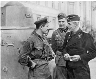
Spotkanie oddziałów niemieckich i sowieckich w Brześciu nad Bugiem, 1939 r.

Najistotniejsze jest jednak to, że ostatecznym rezultatem wojny stała się utrata przez Polskę ponad 45 proc. obszaru sprzed września 1939 r. (ZSRS zaanektował 178 tys. km kw.), co nie zostało w dostateczny sposób zrekompensowane ziemią na zachodzie. Obecnie powierzchnia państwa polskiego jest mniejsza o niemal jedną piątą od przedwojennej powierzchni II Rzeczypospolitej.