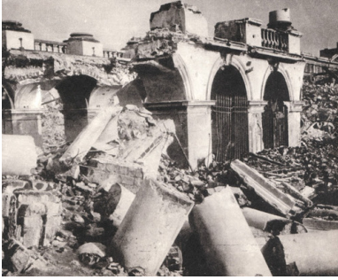
Pałac Saski w Warszawie, wysadzony przez Niemców w grudniu 1944 r.

ponad 60 tys. ludzi. Z kolei między majem a lipcem 1940 r. – 80 tys.; byli to głównie mieszkańcy centralnej i zachodniej Polski uciekający przed Niemcami. Ostatnia fala deportacyjna przypadła na czas między majem a czerwcem 1941 r. i dotknęła blisko 40 tys. osób. Ogółem wywózki objęły ponad 330 tys. obywateli II Rzeczypospolitej, przy czym liczba śmiertelnych ofiar podczas transportów wciąż nie jest znana. Szacunkowo ocenia się, że zginęło ok. 10 proc., głównie najbardziej narażonych, czyli najstarszych oraz dzieci.