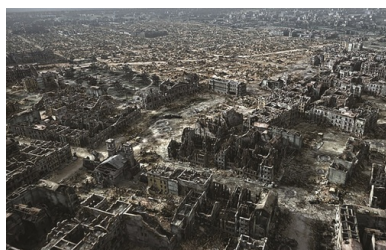
Warszawa w 1945 r. (rekonstrukcja). Kadr z filmu Miasto ruin produkcji Muzeum Powstania Warszawskiego