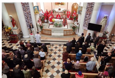
Kościół św. Stanisława w Petersburgu, 7 listopada 2018 r.