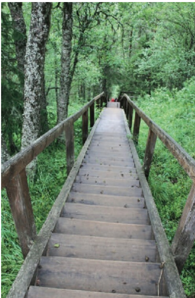
Sołowki, Siekierna Góra. Schody, z których zrzucano więźniów.