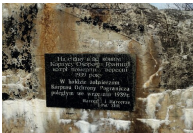
Tablica pamiątkowa poświęcona żołnierzom KOP na ścianie schronu w Tynnem.

Zanim doszło do agresji sowieckiej, żołnierze batalionu KOP „Sarny” czekali na przetrzucenie transportem kolejowym na front zachodni. Po zbombardowaniu przez Niemców 16 września stacji w Równem, a wkrótce przez Sowietów węzła w Sarnach ruch kolejowy na linii Sarny-Równe ustał.