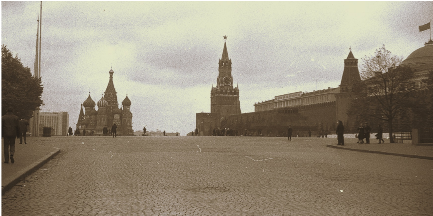
Moskwa, Plac Czerwony.

https://przystanekhistoria.pl/pa2/tematy/zbrodnie-sowieckie/75026,Lawrientij-Pawlowicz-Beria-morderca-za-biurka.html