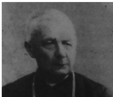
Hryhorij Chomyszyn w 1935 r., po trzydziestu latach posługi biskupiej.

Pomimo, iż 16 października 1945 r. zakończył się jego areszt, to uwięzienie Grzegorza Chomyszyna przedłużało się, a stan jego zdrowia, wskutek represji prowadzonych przez Sowieców i życia w trudnych warunkach więziennych, bardzo się pogarszał. 21 grudnia 1945 r. zdecydowano o umieszczeniu duchownego w szpitalu. Zmarł kilka dni później, 28 grudnia.