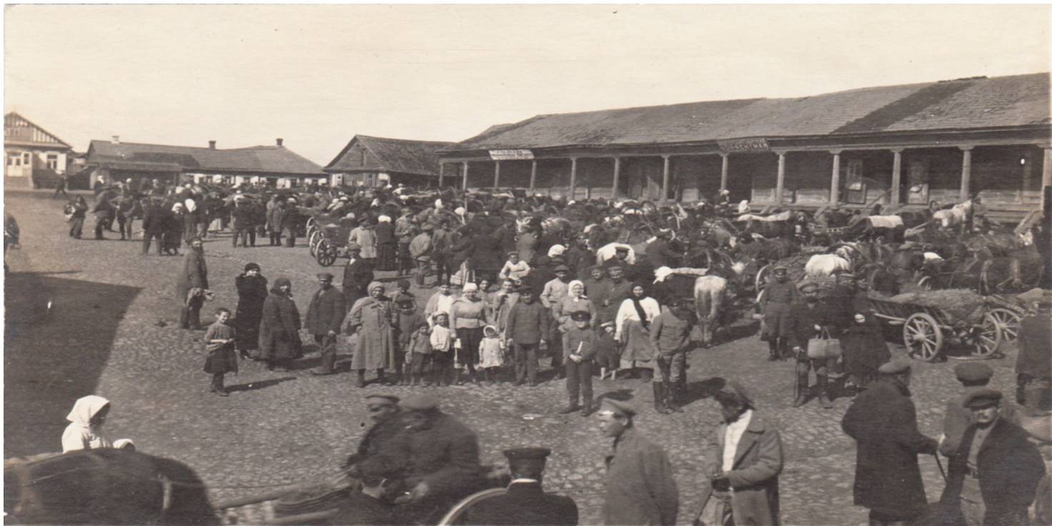
Rynek w Kojdanowie w 1918 roku

https://przystanekhistoria.pl/pa2/tematy/zbrodnie-sowieckie/81613,Nowe-dokumenty-archiwalne-do-dziejow-Dzierzynszczyzny.html