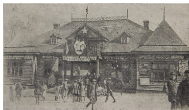
Dom Ludowy w Dzierżyńsku w 1932 r. ozdobiony portretem Feliksa Dzierżyńskiego i szyldem w języku polskim. Do 1932 r. miasto nosiło nazwę Kojdanów

Od czasu publikacji Iwanowa ukazało się szereg mniejszych prac, które podejmowały różne aspekty sowieckiej polityki wobec Polaków w Białoruskiej Socjalistycznej Republice Sowieckiej. W odniesieniu do innych tematów zazębiających się z tematyką funkcjonowania mniejszości polskiej w Sowietach, jak chociażby represje wobec Kościoła katolickiego czy dzieje polskiego ruchu komunistycznego w ZSRS w okresie międzywojennym, można już w Polsce znaleźć bogatą literaturę przedmiotu.