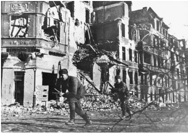
Wkroczenie wojsk sowieckich do Poznań, luty 1945 r.