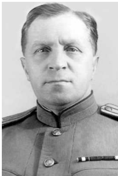
Płk Iwan Nagatkin.