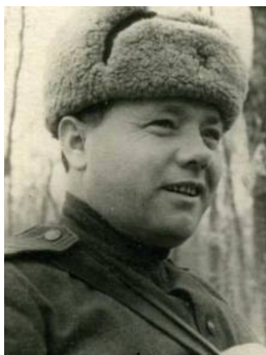
Płk Michaił Fiedosienko. Fot.

„Poza notorycznymi [...] wypadkami grabienia zegarków i innych drobiazgów [...] zachodzą wypadki bardzo poważne. [...] odbył się cały szereg napadów na mieszkania, zachodzą także gwałty, z których jeden doprowadził do śmierci nieletniej dziewczynki”.