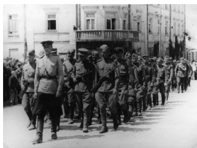
Pogrzeb lotników sowieckich, którzy zginęli podczas ataku polskiego podziemia na lotnisko polowe w Sielcu, pow. Chełm Lubelski, maj 1945 r.

Ostatecznie jednak udało się zatrzymać żołnierza Armii Czerwonej, naprawić auto i usunąć zator z drogi.