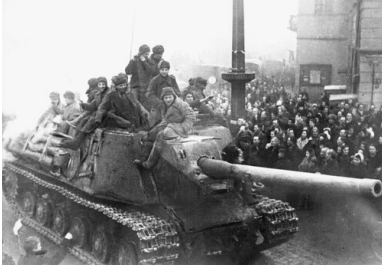
Wkroczenie wojsk sowieckich, luty 1945 r.

Część zabójstw – wydaje się, że znacząca – wiązała się z kradzieżami, bo właśnie rabunki były najpowszechniejszym przestępstwem sowieckich żołnierzy.