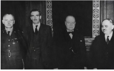
Od lewej: gen. Władysław Sikorski, Anthony Eden, Winston Churchill oraz Iwan Majska z okazji podpisania traktatu polsko-sowieckiego w Londynie 30 lipca 1941 r.

Czy można było uniknąć nieadekwatnego i uwłaczającego obywatelom RP pojęcia „amnestia”, a jednocześnie przywrócić im wolność? Raczej nie, ponieważ Polacy nie mogli, Brytyjczycy zaś nie chcieli, wymóc na Stalinie innego rozwiązania. Mimo swej ułomności przyniosło ono obywatelom RP, udręczonym pobylem na „niehumannej ziemi”, upragnioną wolność. Wielu z nich znajdowało się na skraju wytrzymałości. Kolejna zima niewątpliwie zdziesiątkowałaby populację wywiezionych z Polski.