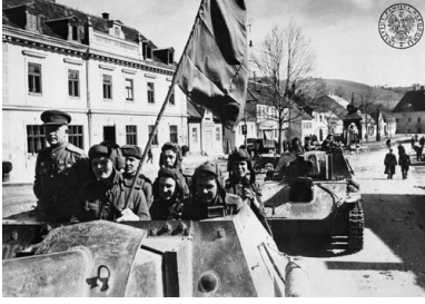
Radzieckie działa samobieżne na ulicy zajętego miasteczka, 1944-1945