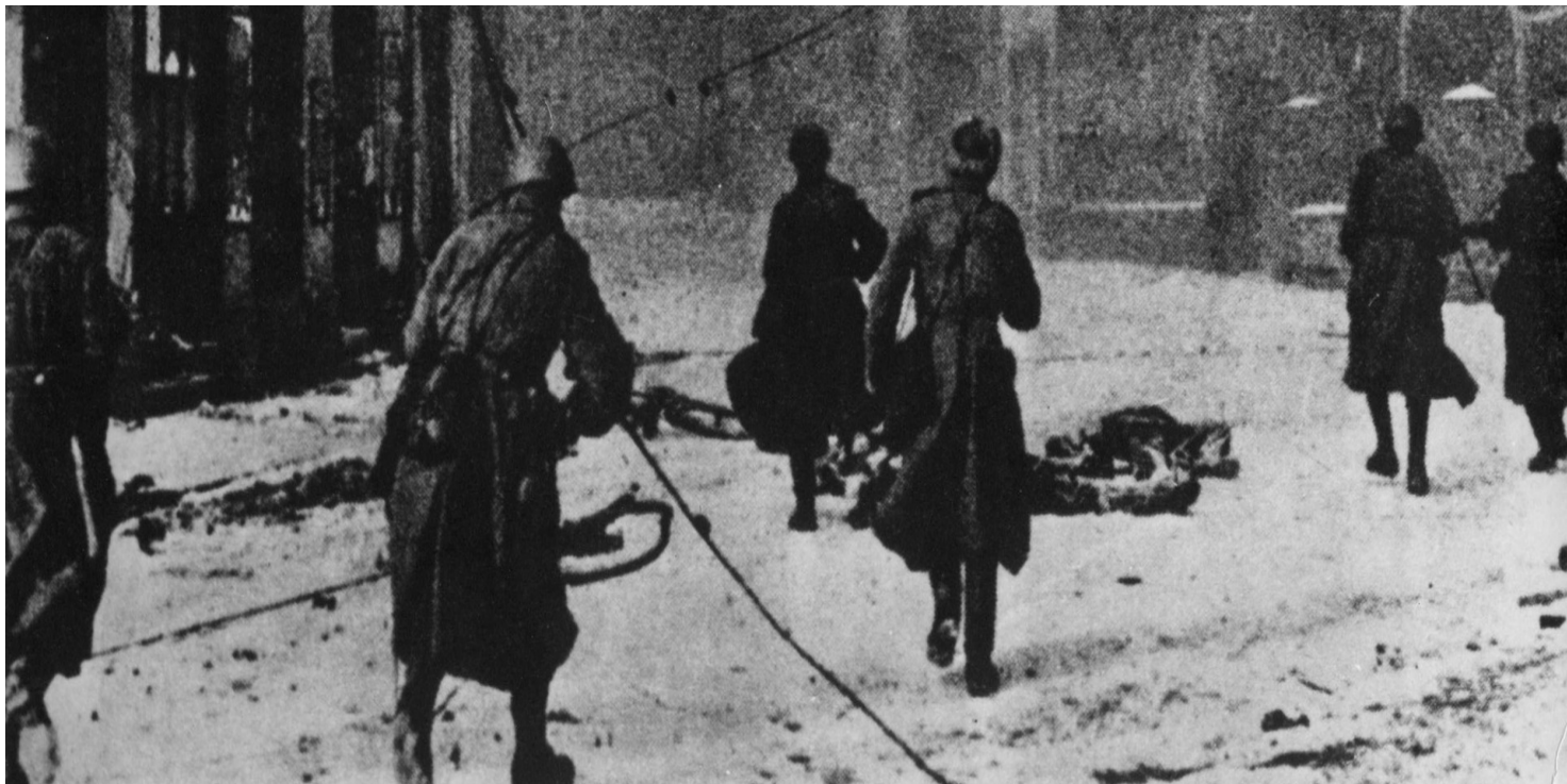
Walki na ziemiach polskich w latach 1944-1945

https://przystanekhistoria.pl/pa2/tematy/zbrodnie-sowieckie/98352,Polowanie-na-mieszkanow-Sowieckie-zbrodnie-w-Miechowicach.html