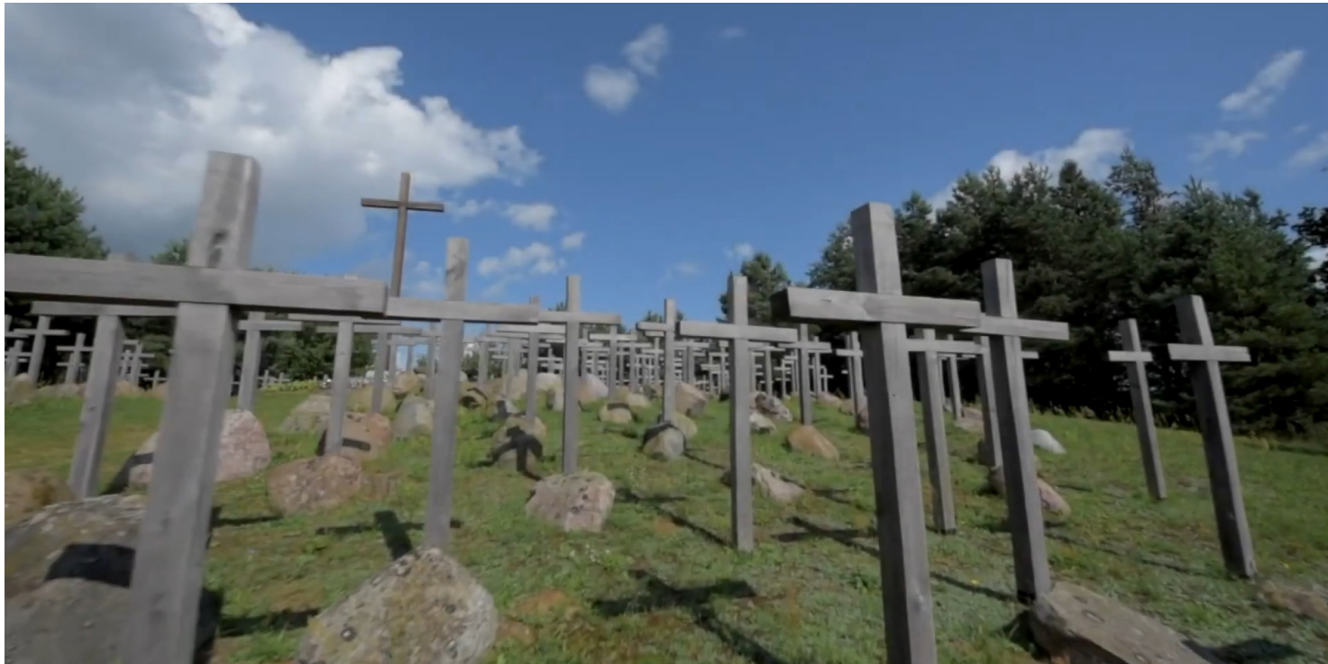
Miejsce upamiętnienia ofiar Obławy Augustowskiej w Gibach

https://przystanekhistoria.pl/pa2/tematy/zbrodnie-sowieckie/99942,Powojenne-wywozki-zolnierzy-AK-studia-przypadkow.html