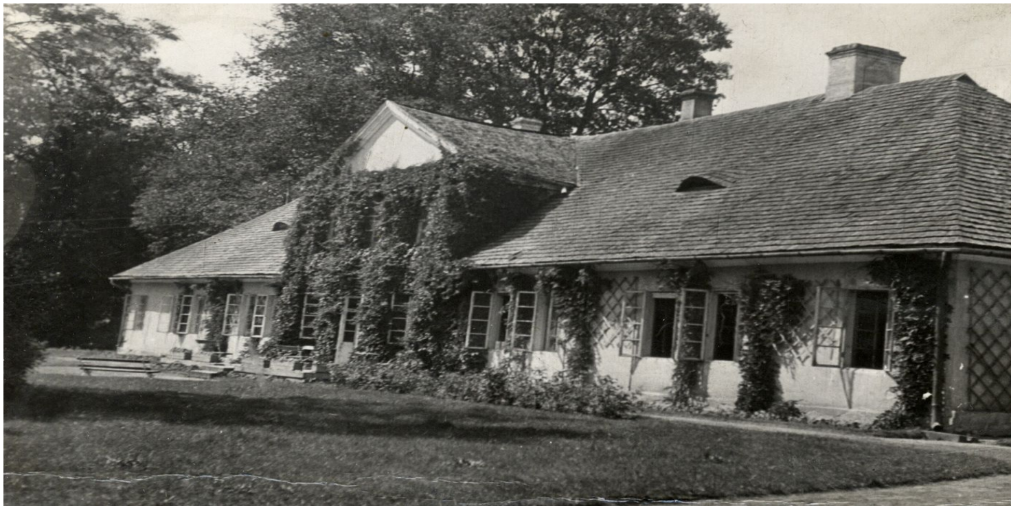
Dwór w Chorzelowie

https://przystanekhistoria.pl/pa2/tematy/ziemianstwo/106126,Karol-Tarnowski-Ziemianin-w-burzliwych-czasach.html