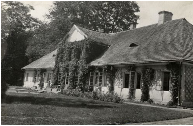
Dwór w Chorzelowie

Współorganizował pielgrzymki środowisk ziemiańskich do sanktuarium na Jasnej Górze czy też reprezentował wspólnie z innymi Związek Ziemian w uroczystościach sprowadzenia do Polski w czerwcu 1938 r. relikwii św. Andrzeja Boboli. Próbował również jeszcze przed wybuchem wojny przygotować zorganizowaną pomoc dla potencjalnych uchodźców z terenów przyfrontowych. Zobowiązał członków Związku do przygotowania miejsc dla uchodźców i ich inwentarza żywego. Inicjował również zbiórkę funduszy na rzecz Pożyczki Obrony Przeciwlotniczej czy też Funduszu Obrony Narodowej, co doprowadziło do przekazania władzom ponad miliona złotych. Należał również do Zarządu Rady Naczelnej Organizacji Ziemiańskich w Warszawie.