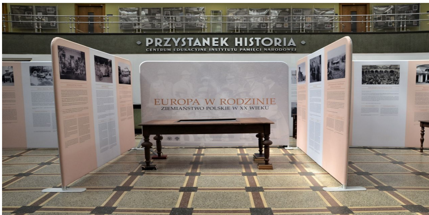
Ziemiaństwo polskie w XX wieku. Wystawa na „Przystanku Historia” w Krakowie

https://przystanekhistoria.pl/pa2/tematy/ziemianstwo/106177,Misja-upamietnienia-ziemianstwa.html