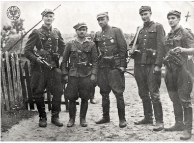
Żołnierze 5. Brygady Wileńskiej AK. Białostoczczyzna, 1945 r.