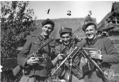
Członkowie 5. Brygady Wileńskiej