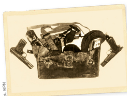
↳ Torba z uzbrojeniem znaleziona przy zabitym „Lalusiu”

Poszukiwania „Lalusia” prowadzone przez UB i SB były oznaczone kryptonimem „Pożar”. Działaniami operacyjnymi objęto jego najbliższą rodzinę i znajomych. Podejmowano próby pozyskiwania konfidentów, którzy mieli obserwować i dostarczać informacji dotyczących jego najbliższych krewnych i pomocników. W domach kilku z nich zainstalowano aparaturę podsłuchową.