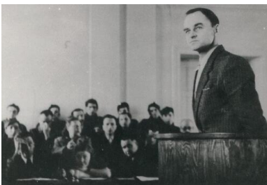
Witold Pilecki przed Wojskowym Sądem Rejonowym w Warszawie.