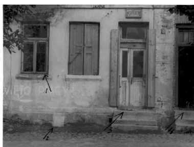
Siedziba KG PZPR w Goniądzu