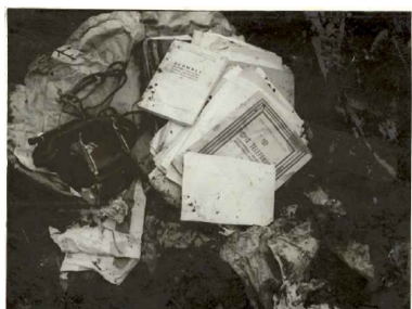
Skradziona dokumentacja i maszyna do pisania

W dniu 31 marca 1982 r. został zwolniony z miejsca odosobnienia (pismo do komendanta KW MO w Białymstoku skierował w tej sprawie rektor Politechniki Białostockiej). Mimo że pozwolono mu powrócić do pracy w uczelni, nie zaniechano dalszej inwigilacji. Kontrolę figuranta zaplanowano w kierunku dokumentowania dalszych form jego działalności, szczególnie przed zbliżającymi się wyborami do Sejmu PRL.