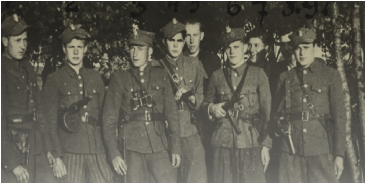
Żołnierze 5. Wileńskiej Brygady AK, sierpień 1946 r.

https://przystanekhistoria.pl/pa2/tematy/zolnierze-wykleci/89911,Niezlomni.html