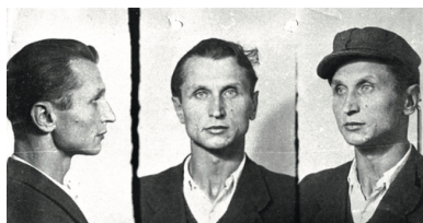
„Warszyc” - zdjęcia sygnalityczne

więźniów (jak w kwietniu 1946 r. w Radomsku), rozbijało obławy. Mocno osadzony w terenie mógł liczyć na pomoc miejscowej ludności – docierał do niej również za pośrednictwem ulotek i gazetek. W ręce bezpieki dostał się z powodu zdrady w połowie 1946 r. – stracono go 19 lutego 1947 r. w Łodzi.