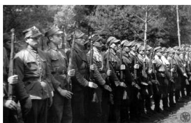
Kurs podoficerski Obwodu Tomaszów Lubelski AK-DSZ, wiosna 1945 r.