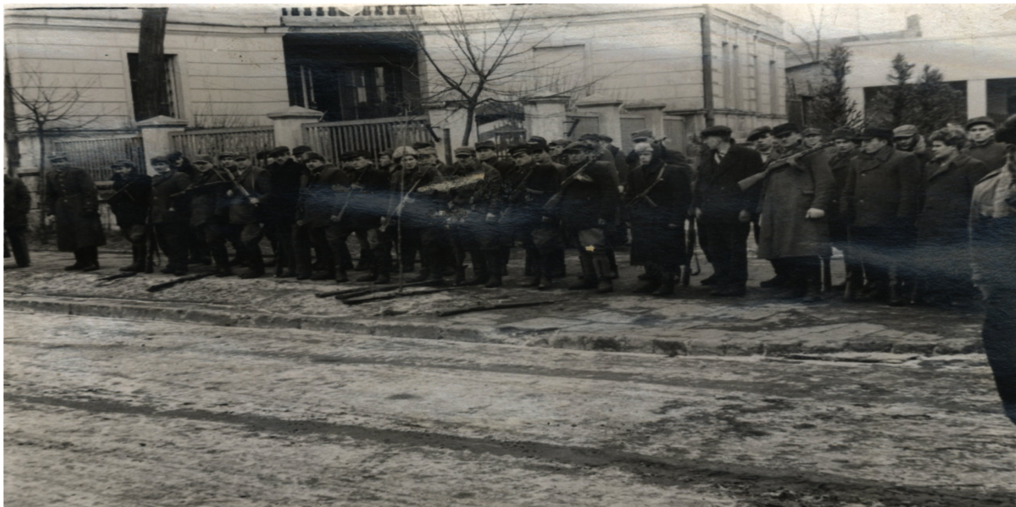
Oddział „Prawdźica”, Radomsko

https://przystanekhistoria.pl/pa2/tematy/zolnierze-wykleci/99093,Ujawnianie-struktur-Konspiracyjnego-Wojska-Polskiego-wiosna-1947-roku.html