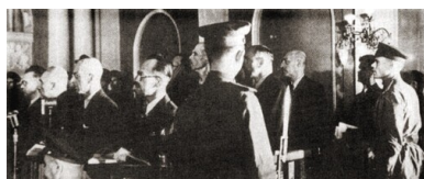
Ława oskarżonych w procesie Szesnastu, Moskwa, czerwiec 1945 r.

Jak z tego wynika, wiosną 1945 r. Churchill walczył ze Stalinem o niezawisłą Polskę – acz w nowym kształcie terytorialnym i bez legalnego rządu polskiego 18 . Sojusznikiem Anglika w tej walce miał być Mikołajczyk. Churchill zrobił wszystko, by przełamać sowiecki opór przeciwko jego zaproszeniu do Moskwy, co miało umożliwić polskiemu politykowi niedopuszczenie do powstania Tymczasowego Rządu Jedności Narodowej zdominowanego przez komunistów.