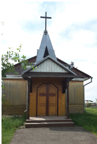
Kościół św. Antoniego z Padwy wybudowany w 1907 r.

„Do kościoła chodzili wszyscy, od malców po staruszków – Haniewicz przytacza wspomnienia Zoi Czerkaszyny. – Przychodził maj i wtedy codziennie byliśmy w świątyni. Mężczyźni stali po prawej stronie [...], kobiety z lewej, my, dzieciarnia, modliliśmy się na kolanach. Niektórzy z dorosłych także na kolanach. Mężczyźni raczej stali, a ławki były dla tych, którzy modlitwy z książeczki potrafili odczytywać. Chór był zawsze przystrojony. [...]. Pięknie i świątecznie było zwłaszcza w większe uroczystości kościelne. Przed Wielkanocą urządzaliśmy Drogę Krzyżową wokół kościoła, a dwa dzwony nieustannie dzwoniły. Daleko było je słyszeć”.