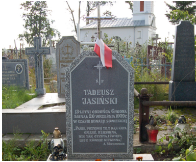
Grób Tadeusza Jasińskiego, najmłodszego obrońcy Grodna

poddano także żołnierzy polskich. Rozstrzelano m.in.: ok. 300 obrońców Grodna czy ok. 150 marynarzy Flotyli Pińskiej, zamordowano gen. Józefa Olszynę-Wilczyńskiego, dowódcę Okręgu Korpusu nr III Grodno i jego adiutanta kpt. artylerii Mieczysława Strzemeskiego.