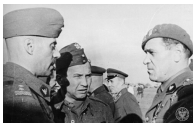
Dowódca Armii Polskiej w ZSRS

dr hab. Sławomir Kalbarczyk (SK): Napisałem książkę popularnonaukową - i był to wybór całkowicie świadomy. Uznałem, że tak ważki i nośny temat, jakim jest fenomen Armii gen. Andersa na terytorium sowieckim i pewne nowe ustalenia badawcze, które są zawarte w tej książeczce, nie powinny ograniczać się do wąskiego kręgu specjalistów. Tak zapewne by się stało, gdybym przygotował pracę ściśle naukową, na - dajmy na to - 700 czy 800 stron. A czym praca ta różni się od innych książek poświęconych temu tematowi? Jak już wspomniałem - są w niej zawarte pewne nowe ustalenia, mam nadzieję, że nie najgorzej udokumentowane. Zatem jedynie w pewnym zakresie praca ta powtarza to, co już wiemy. Są nowe wątki, nowe fakty i nowe interpretacje. Warto o nich wiedzieć, bo historia - to także nasza współczesność. Przecież dzisiaj znaczna część rosyjskiej historiografii głosi tezę o „winie” władz polskich za rzekomo jednostronne wprowadzenie Armii Andersa ze Związku Sowieckiego. Warto wiedzieć, jak było naprawdę.