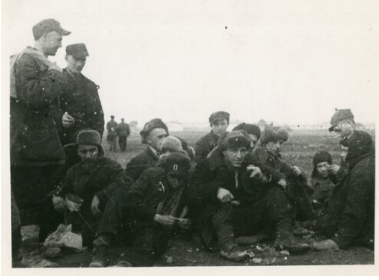
Raj - Stalina... Po "amnestji" (z odwrocia fotografii). Uwolnieni z łagrów sowieckich po przybyciu do Armii gen. Andersa, grudzień 1941 r.