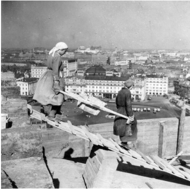
Kobiety pracujące przy budowie Hotelu „Moskwa” w Moskwie, 1935 r.

RL: Zdjęć z pobytu Bryana w Związku Sowieckim jest bardzo dużo. Jakie przyjął Pan kryteria doboru poszczególnych fotografii do publikacji?