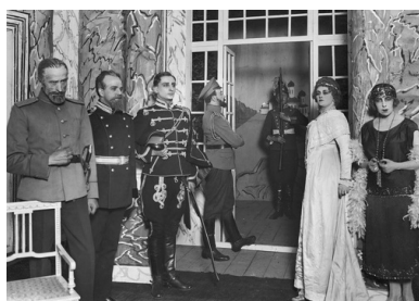
Przedstawienie "Śmierć cara Mikołaja II" w Teatrze im. Aleksandra Fredry w Warszawie, 1926 r.

Miller, spędzający dużo czasu w Paryżu, narzekał w polskiej ambasadzie, że nikt na Quai d`Orsay nie