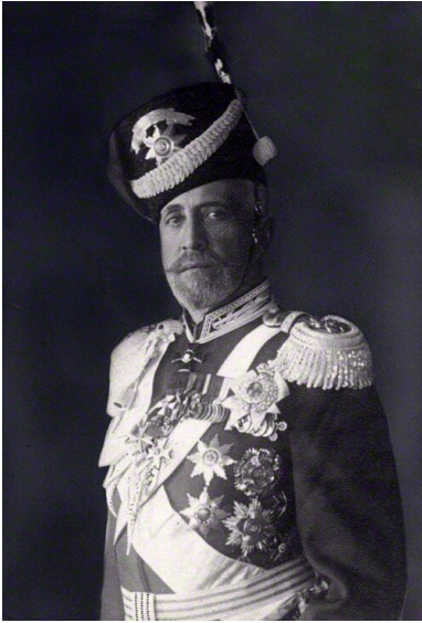
Mikołaj Mikołajewicz Romanow (1856-1929)