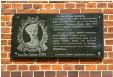
Tablica poświęcona generałowi Wranglowi w Uljanowie w obwodzie kaliningradzkim, 2014 r.

wyłącznie ze względu na ogólną sympatię dla całego ruchu „białogwardyjskiego”. Ten zaś miał być niepodzielnie skupiony wokół W. Ks. Cyryla, uosabiającego trwanie Rosji i dynastii Romanowów, co jak wiemy, nie odpowiadało prawdzie.