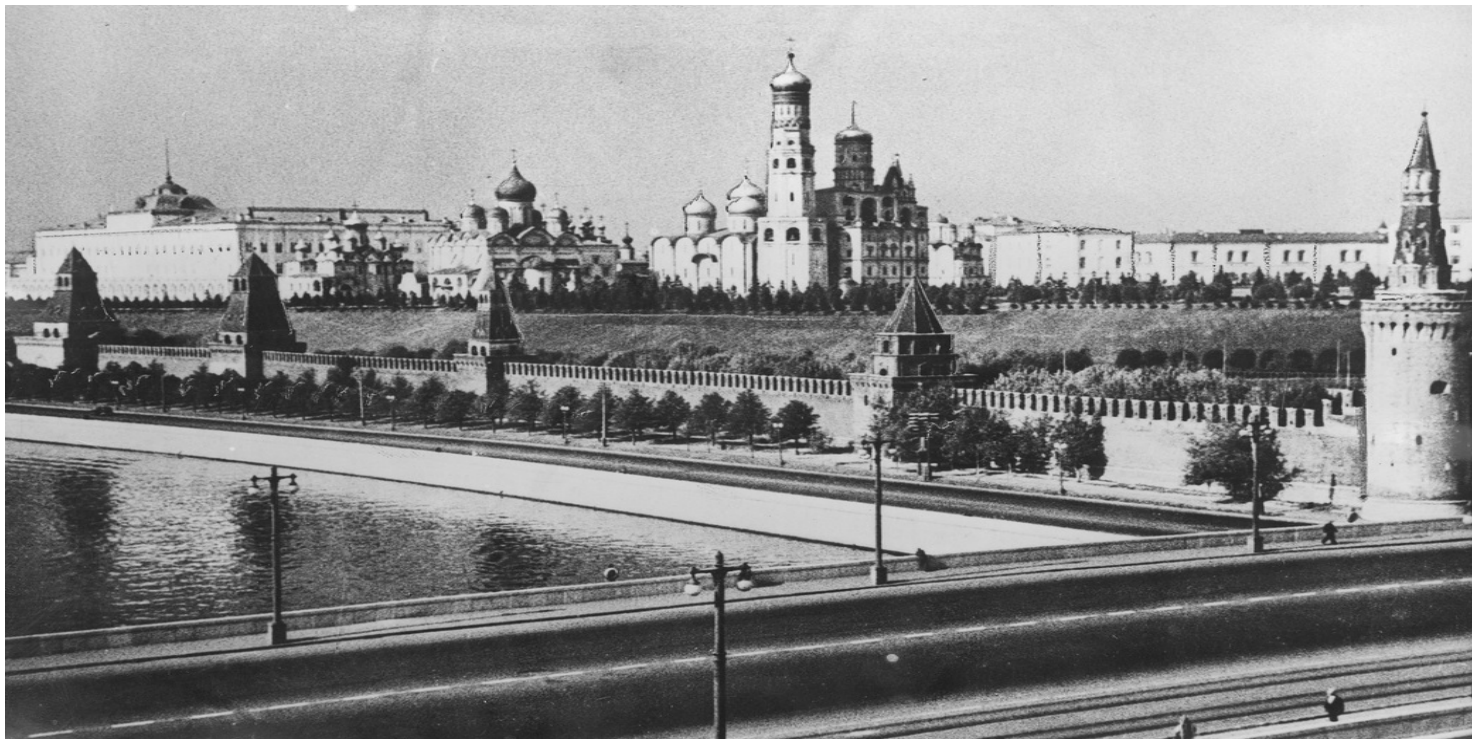
Panorama Kremla z mostu Moskwockiego

https://przystanekhistoria.pl/pa2/tematy/zsrs/78319,Z-historii-pewnego-zludzenia-O-rodzinie-carskiej-w-latach-20-i-30-XX-w-na-podsta.html