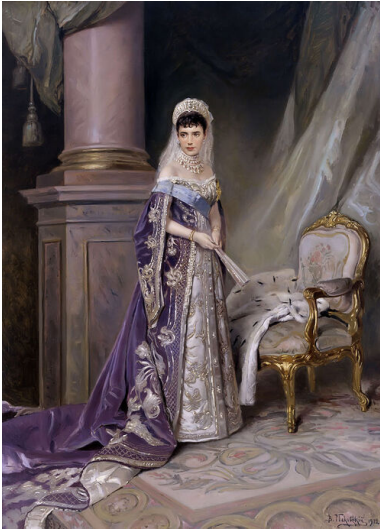
Maria Fiodorowna Romanowa (1847-1928)