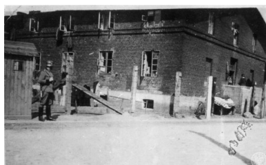
Zabudowania kutnowskiego getta przy ul. Mickiewicza, 1940-1942.

Przed wojną w Kutnie mieszkało około 8 tys. Żydów. Już we wrześniu 1939 r. Niemcy zaczęli ich dyskryminować i wykorzystywać do różnych przymusowych prac fizycznych: