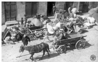
Wysiedlanie kutnowskich Żydów do getta, 16 czerwca 1940 r.

Poprzedniego dnia polskim mieszkańcom tego miasta nakazano pozostanie przez cały dzień w domach, z wyjątkiem właścicieli wozów i koni, którzy na godzinę piątą rano mieli dostarczyć podwozy. Środków transportu było jednak za mało i wiele rodzin miało trudności z przewiezieniem swego dobytku. Nadzorujący przesiedlenie niemieccy policjanci wyszydzali i bili Żydów.