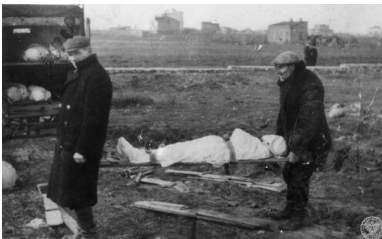
Przygotowanie do pochówku zmarłych w getcie w Kutnie, 1940-1942.

Na otoczonym murem i drutem kolczastym obszarze o powierzchni zaledwie ok. 5 ha, w zniszczonych zabudowaniach pofabrycznych i kilku domach mieszkalnych, stłoczono wszystkich kutnowskich Żydów. Gęstość zaludnienia była większa niż w getcie łódzkim, sięgając w przeliczeniu 160 tys. osób na km 2 . Dla wielu ludzi nie starczyło miejsca w budynkach i musieli nocować pod gołym niebem. Trudną sytuację pogorszyła dodatkowo epidemia tyfusu plamistego, która wybuchła na początku 1941 r. W jej następstwie getto zostało zamknięte, co jeszcze ograniczyło kontakty z ludnością polską i możliwość zdobycia żywności. Położenie mieszkańców stało się bardzo ciężkie, panowała ciasnota, fatalne warunki sanitarne i głód. W pierwszej połowie 1941 roku zmarło 412 osób.