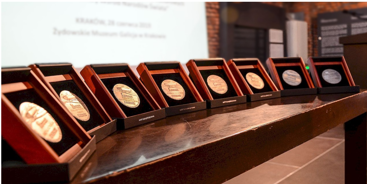
Madale Sprawiedliwy wśród Narodów Świata przyznawane przez Instytut Yad Vashem.

https://przystanekhistoria.pl/pa2/tematy/zydzi/76535,Stella-czyli-gwiazda-O-Stelli-Zylbersztajn-Tzur.html