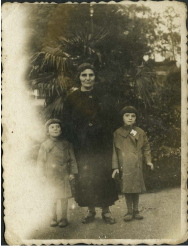
Stopniccy Żydzi

między innymi w dwóch domach modlitwy. W jednym mieszkało 110 osób, w drugim zaś 40. Tylko w jednym budynku umieszczono łóżka. Z powodu głodu, do czerwca 1941 r. zmarło 400 osób. Ze względu na ścisk i kiepskie warunki sanitarne, w getcie wybuchł dur plamisty.