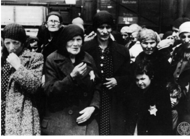
Kobiety z dziećmi z transportu Żydów z Węgier na rampie boczniczy kolejowej w obozie zagłady KL Auschwitz-Birkenau, maj 1944 r.