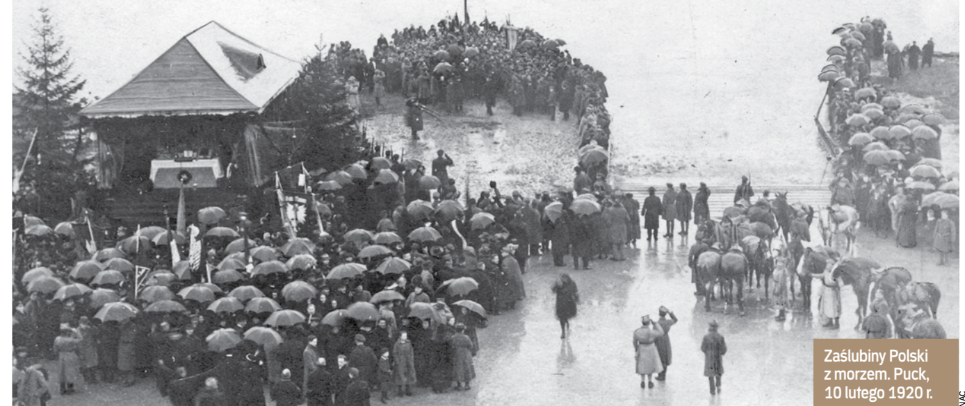
Zaślubiny Polski z morzem. Puck, 10 lutego 1920 r.