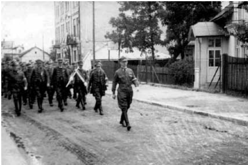
Harcerze z Kleparowa maszerują ze sztandarem na uroczystość patriotyczną, Lwów 1938 r.

zastępy, drużyny, a sporadycznie nawet hufce. Tam, gdzie nie powstała harcerska konspiracja, druhowie przystępowali do organizacji różnych nurtów politycznych i wojskowych. Działalność podziemna nasiliła się zwłaszcza w latach 1949–1951, kiedy władze wobec niepowodzenia działań zmierzających do całkowitego opanowania ideologicznego ZHP zarzuciły próby przejęcia kontroli nad związkiem i stopniowo wcieliły go do Związku Młodzieży Polskiej (ZMP) jako jego młodzieżową przybudówkę, zezwalając na przynależność do harcerstwa jedynie dzieciom do 16 roku życia.