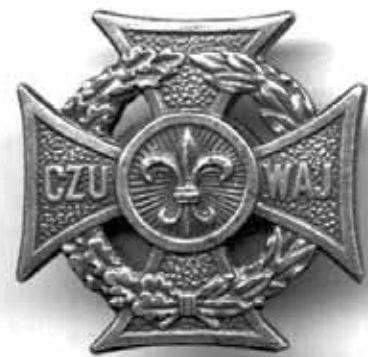
Krzyż ZHP z okresu PRL

Obywatelski sprawdzian harcerstwo zdało w czasie II wojny światowej celująco. Dziewczeta pierwsze dostrzegły niebezpieczeństwo i już w 1938 r. powołały Pogotowie