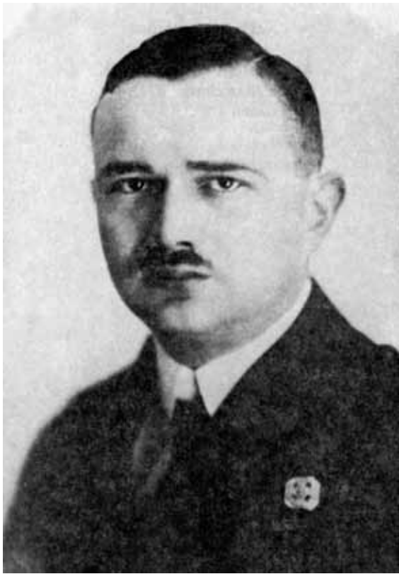
Stanisław Siedlaczek (1892–1941), naczelnik Harcerstwa Polskiego – „Hufców Polskich”, zamordowany w KL Auschwitz

tamtym terenie. Całe kierownictwo organizacji otrzymało wyroki śmierci, które zostały wykonane.