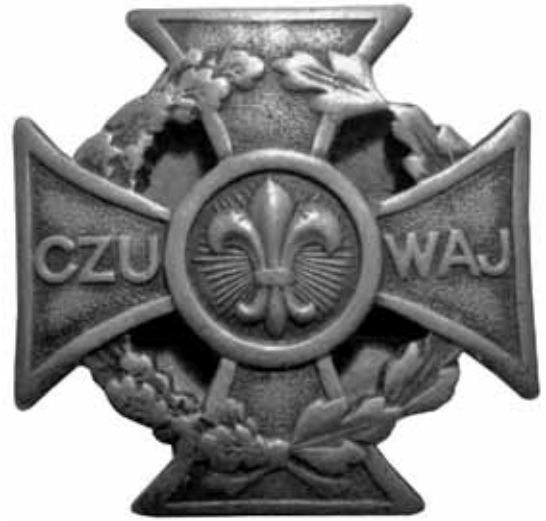
Krzyż Harcerski według wzoru przedwojennego