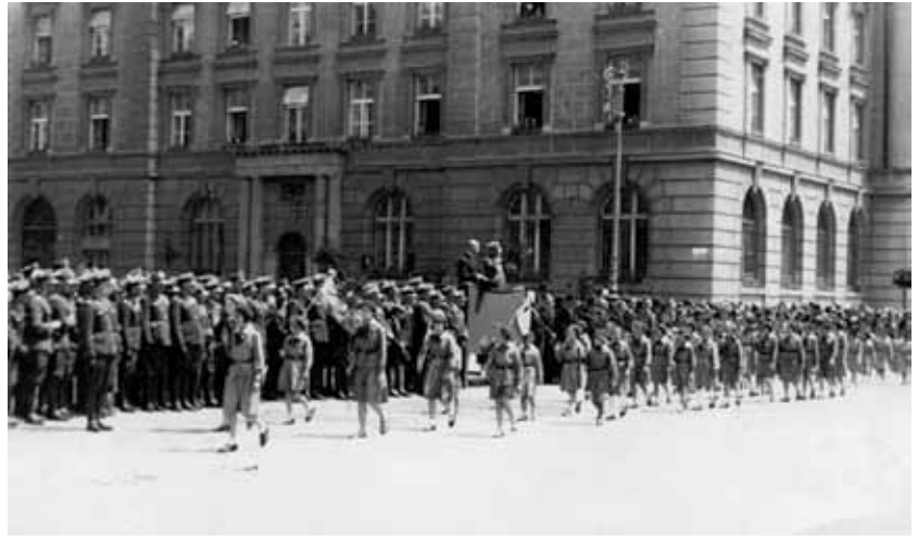
Defilada zastępu harcerek przed marszałkiem E. Śmigłym-Rydzem z okazji święta 15 sierpnia, Kraków 1939 r.

W czasie wojny Szare Szeregi opracowały plan wychowawczy „Dziś – Jutro – Pojutrze”. Celem było to, by dziś wychować człowieka, który jutro stanie do walki z okupantem, a pojutrze będzie gotowy do odbudowy wolnej ojczyzny. Dlatego też w wychowaniu starano się eliminować wszelkie elementy, które mogły w trudnych wojennych czasach deprawować młodzież. Program ten realizowano w trzech grupach wiekowych: najmłodszy w wieku 12–14 lat tworzyli drużyny zawiszackie. W zasadzie były to zakonspirowane, spotykające się w domach lub w lesie drużyny i zastępy zdobywające przedwojenne stopnie i sprawności, obowiązywała ich, o ile warunki na to pozwalały, nauka na tajnych kompletach. W ramach programu przygotowujących do służby pomocniczej o kryptonimie